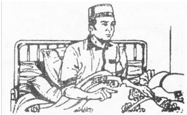
Duduk Tahiyat Awal/akhir