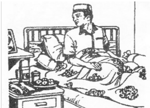
Salam ke kanan dan ke kiri