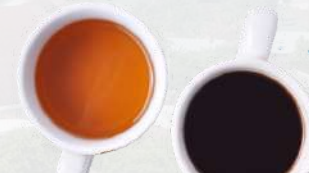
Teh & Kopi