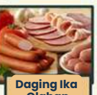
Daging Ika Olahan